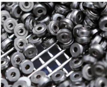
Mit den neuen «Mefo»-Boxen mit einer Maschenweite von 4 mm lassen sich Kleinteile effizient als Schüttgut reinigen.

Spezifikationen zur partikulären und/oder filmischen Sauberkeit sind heute in zahlreichen Branchen eine Selbstverständlichkeit – und das auch immer häufiger bei der Reinigung von Schüttgut. Um diese Anforderungen stabil und wirtschaftlich zu erfüllen, spielt das Reinigungsbehältnis eine entscheidende Rolle. Mit dem «Mefo»-Box-System hat Metallform ein ab Lager lieferbares Standardprogramm an Reinigungs- und Transportkörben sowie Zubehörkomponenten entwickelt. Die Behältnisse werden aus Edelstahl-Rundstäben mit elektropolierter Oberfläche gefertigt und gewährleisten dadurch die gute, allseitige Zugänglichkeit für Reinigungsmedium und Waschmechanik zu den Teilen, minimieren Verschleppungen und verbessern die Trocknung. Das hochwertige Material ist für alle Reinigungsmedien geeignet und ermöglicht eine lange Nutzungsdauer der Behältnisse. Die Verschweissung der Rundstäbe erfolgt stumpf, so dass keine scharfen, verletzungsgefährlichen Ecken an den Reinigungskörben vorhanden sind.