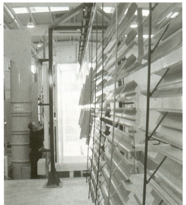
«SurTec 609 A ZetaClin» auf feuerverzinkten Stahlprofilen bei der Bearbeitung.

Gegenüber nanokeramischen Schichten hat «ZetaClean» den Vorteil, dass dieser Schutz mit seinen Silber- bis Goldtönen meistens sichtbar ist und eine einfache visuelle Kontrolle ermöglicht. Es erfolgt keine lästige Schlammabildung, wie dies bei Phosphatierungen der Fall ist. Das Verfahren ist frei von Phosphaten, Nitraten, Zink, Nickel, Mangan und flüchtigen organischen Substanzen und daher besonders umweltgerecht. Es erfüllt die Anforderungen der RoHS und der WEEE, ist wirtschaftlich und einfach in der Anwendung. ■